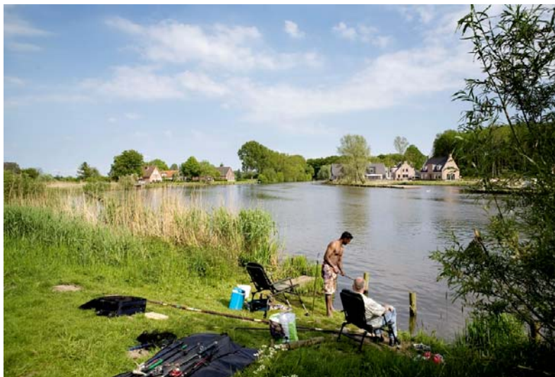
Water om van te genieten

Deze nota bevat uitgangspunten en criteria voor het nemen van besluiten over maatregelen op het gebied van recreatief medegebruik, landschap en cultuurhistorie. Het beleid past binnen de doelstellingen van de Waterwet.