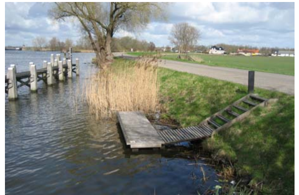
Kano-overstapplaats bij de Weerdsuis, Utrecht en bij de sluis 't Hemeltje bij de Vecht