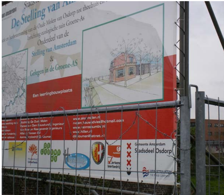
Restauratie van de Oude Molen in Osdorp, onderdeel van de Stelling van Amsterdam