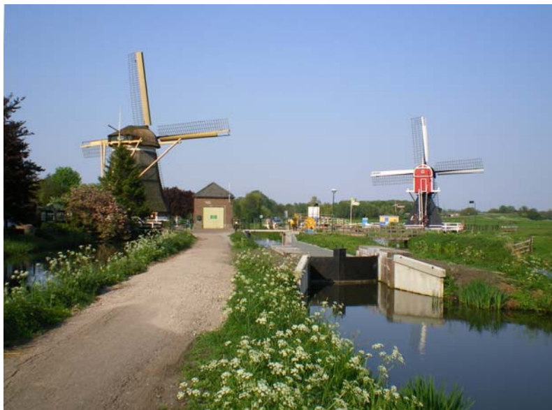
Molens en gerestaureerde sluis Westbroek bij Oud-Zuilen

In sommige gevallen is het mogelijk om gebruik te maken van communicatiebudget. Het gaat dan om maatregelen of activiteiten die vooral bedoeld zijn voor voorlichting, educatie, communicatie of promotie en die niet direct te koppelen zijn aan een reguliere taak van het waterschap. Bijvoorbeeld een wandel- of kanoroute langs elementen van het watersysteem, met informatie daarover.