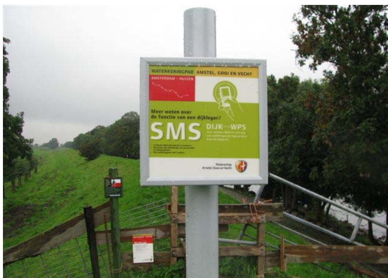
Wandelpad AGV: over keringen van het waterschap

Het watersysteembeheer en het nautisch - en vaarwegbeheer komen in deze nota niet aan de orde. Voor deze taken geldt specifiek beleid en regelgeving 1 . Ook maatregelen voor zwemwateren komen in deze nota niet aan de orde. Hierin volgt het waterschap de Europese Zwemwaterrichtlijn. Tot slot gaat de nota ook niet in op de zorg voor archeologische waarden. Hiervoor houdt het waterschap zich aan het Europese verdrag van Malta/Valletta waarvan de uitgangspunten in Nederland zijn vastgelegd in de nieuwe Monumentenwet .