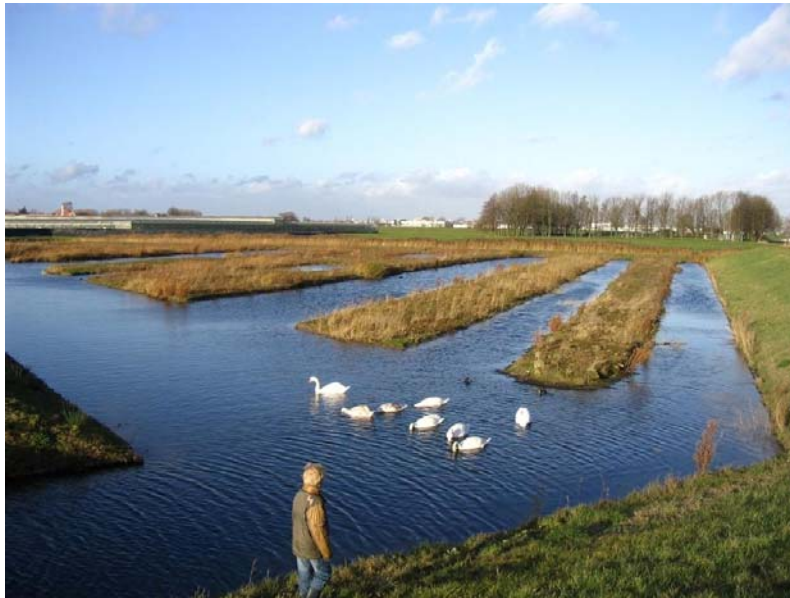
Egeltjesbos: een natuur-, recreatie- en waterbergingsgebied in één