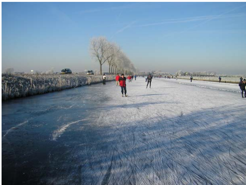
Schaatsers op het Hilversums Kanaal, 2009

2002 wordt in 2011 geëvalueerd en geactualiseerd. Op basis daarvan wordt in 2012 een (nieuwe) lijst met elementen of objecten om te herstellen opgesteld.